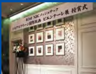
前回会場イメージ